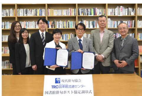
「図書館俳句ポスト」協定調印式の様子