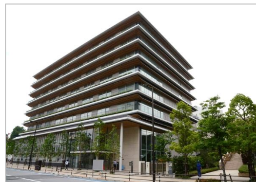
品川リハビリテーションパーク外観