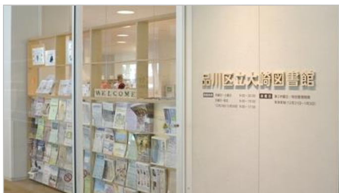
建物内図書館入口

※品川リハビリテーションパーク：介護老人保健施設と病院で構成され、公益財団法人河野臨牀医学研究所が運営