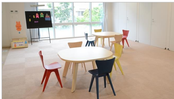
街の緑がきれいなおはなしのへや