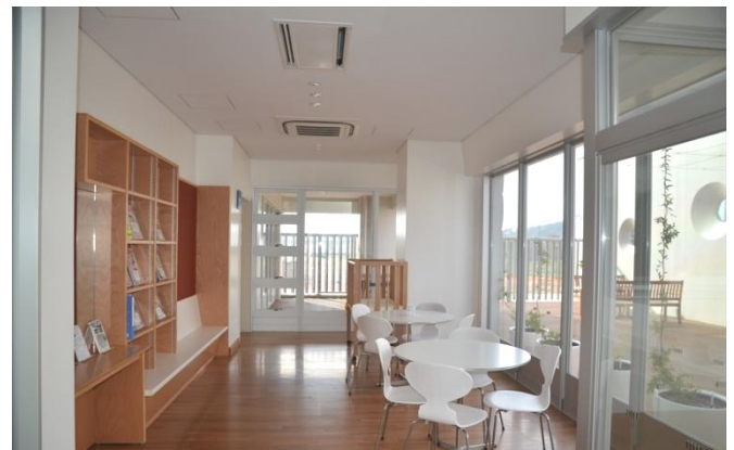
児童フロア内「ほっとコーナー」