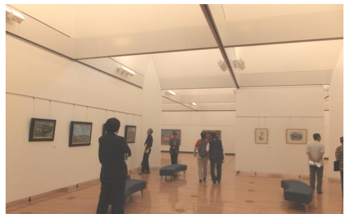
市民ギャラリー展示室ホール内の様子