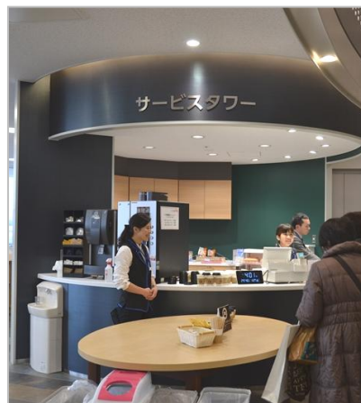
図書館部分 指定管理者 図書館流通センター

【あかし市民図書館】（住所：兵庫県明石市大明石町一丁目6番1号 パピオスあかし 4F） 2017年1月27日にあかし市民図書館が、明石駅前南口の複合施設『パピオスあかし』4Fに新規移転オープンしました。図書館内には飲物を販売するサービスタワーと飲物OKのラウンジもあります。明石駅前再開発で建築された『パピオスあかし』は5階にあかし子育て支援センター・一時保育ルーム、6階に明石市の行政窓口・こども健康センターが配置され、2階にジュンク堂書店、1～3階には飲食や物販、クリニックなど商業施設、連結した住宅棟があります。商業／公共施設が明石駅前1カ所に集約され、市民の利便性が高まりました。開館から30日目の2017年2月25日に来館者10万人を達成しました。