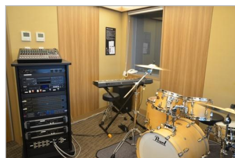
指定管理者 やまとみらい/図書館部分 図書館流通センター/屋内こども広場部分 株式会社 明日香