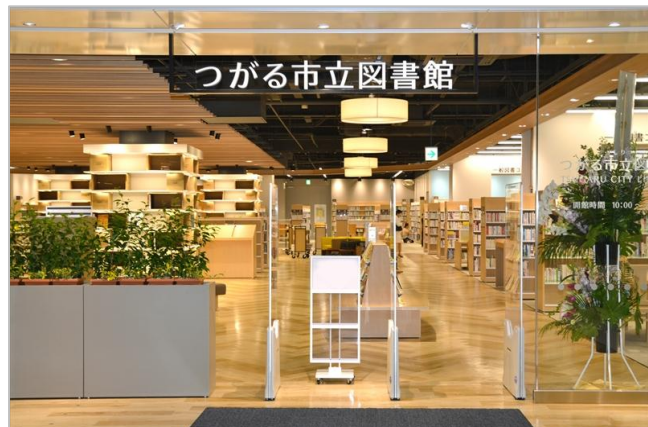
指定管理者 図書館流通センター

【つがる市立図書館】（住所：青森県つがる市柏稲盛幾世 41 イオンモールつがる柏 別館 1F） 2005年2月11日に1町4村が合併して誕生したつがる市は、市町村合併以前から「図書館のない町」で、長らく図書館設置の検討を続けていました。イオンモールと図書館総合研究所による「イオンモールつがる柏」別館への図書館設置についての提案をつがる市が受け、2016年7月29日に市民待望の図書館がイオンモール内に誕生しました。イオンモール内の図書館は、東日本では初の事例となります。開館から多くの方に利用され、約半年後2017年2月15日に来館者20万人を突破しました。