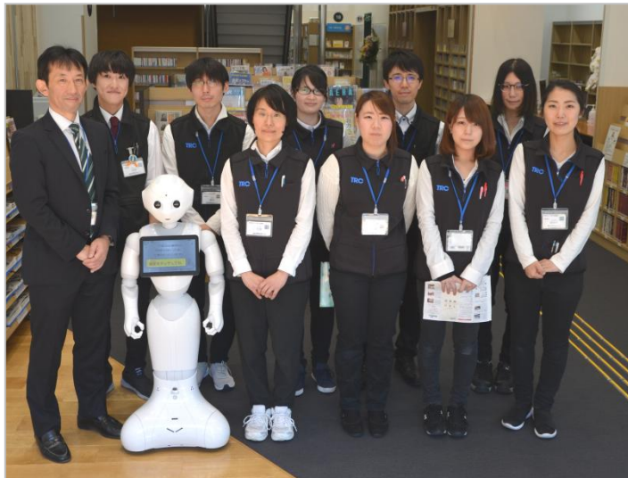
江戸川区立篠崎図書館