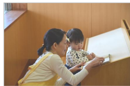
水戸市立見和図書館

「子どもが騒ぐのが心配で図書館に来館できない」「子どもが泣いて他の利用者に怒られた」「子どもが本をめちゃくちゃにするのでゆっくり本も選べない」などの子育て世代の悩みを解決すべく、2015年7月7日に図書館利用者向けの無料一時保育をTRC八千代中央図書館で開始しました。週3回、10時～14時の実施はお母さんたちの口コミで評判が広がり、現在ではいつも満員で予約が必要なほどです。現在ではTRCが受託運営する図書館のうち、全国24の図書館で一時保育やイベント時の託児、育児コンシェルジュのサービスを実施しています。