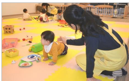
TRC 八千代中央図書館