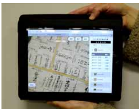
タブレット型端末で拡大してもくっきり表示

石川県史 トップ画面 https://trc-adeac.trc.co.jp/WJ11C0/WJJS02U/1700105100